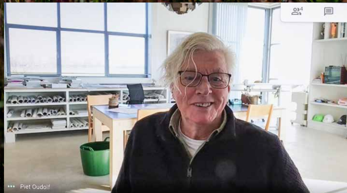
Tuinkunstenaar Piet Oudolf: "Ik probeer mijn hele leven al emoties te versterken, waardoor een tuin een eigen wereld wordt."