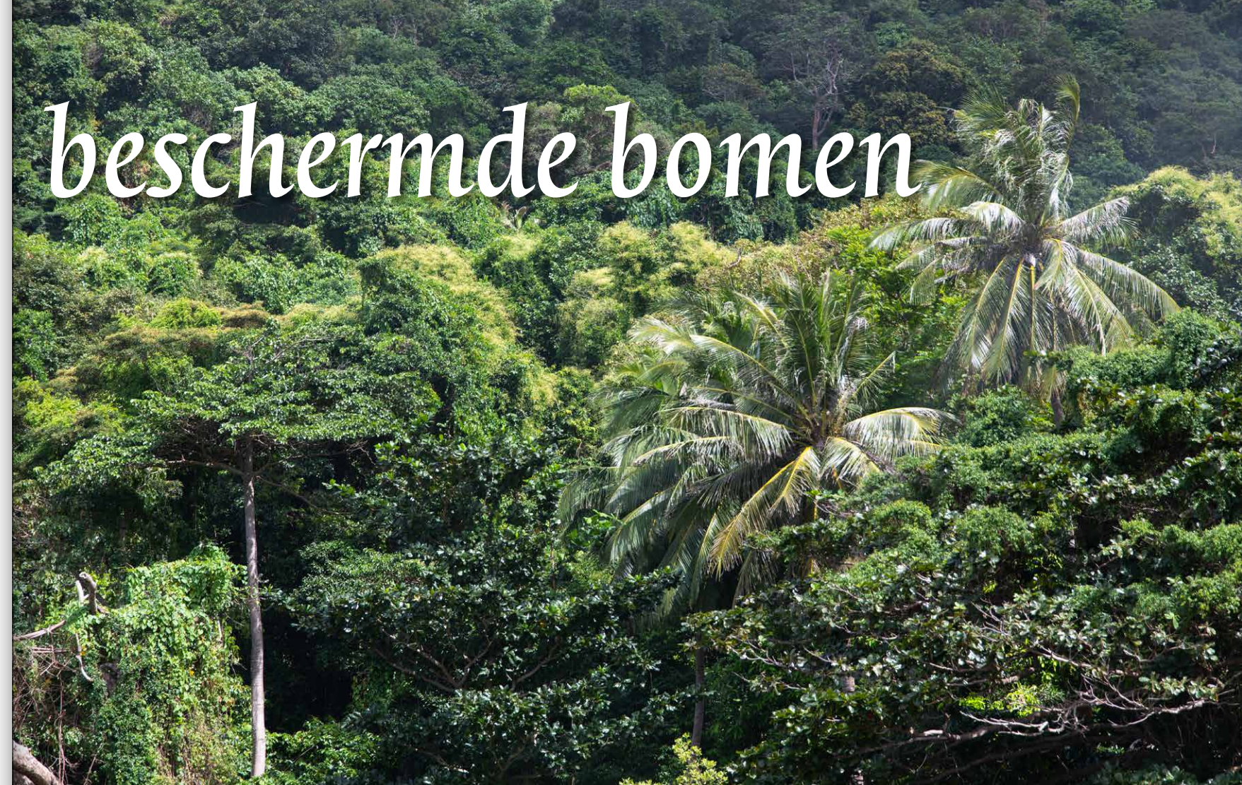
De levende monumenten op de Con Dao-eilanden staan soms diep verscholen in het tropische bos. 8°43'51.8"N 106°37'10.6"E

Ook al is hun aantal in deze archipel overweldigend, op het vasteland van Vietnam staan nog veel oudere exemplaren. In Da Nang staat een ‘banian tree’ ( Ficus begalensis ) van 800 jaar, luisterend naar het koosnaampje ‘My Khe’. Het is volgens de Vietnamezen een van de zes mooiste bomen op deze planeet. In Do Son staat een vijgenboom die al duizend jaar oud moet zijn, de ‘Tree God’. In een bos in de provincie Quang Nam staan maar liefst 725 gigantische ‘Po Mu’ bomen ( Fokienia hodginsii ) waarvan er ook meerdere een eeuw oud zijn. Deze boomsoort staat op de rode lijst van bedreigde soorten van de IUCN. Ook daarom werd het complete bos bijgeschreven in het nationale Heritage register.