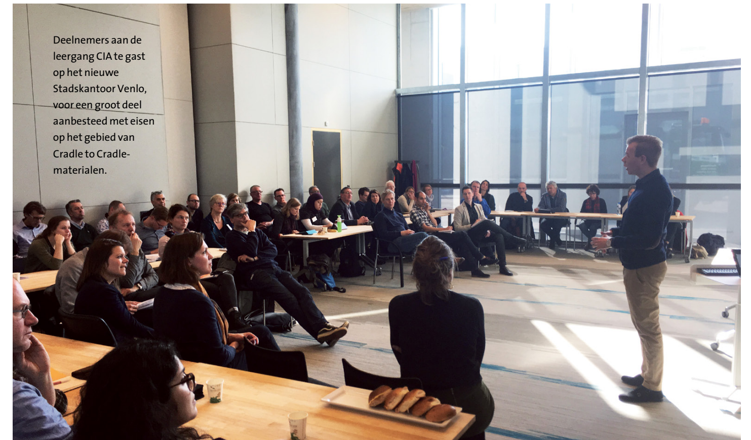
Deelnemers aan de leergang CIA te gast op het nieuwe Stads Kantoor Venlo, voor een groot deel aanbesteed met eisen op het gebied van Cradle to Cradle-materialen.