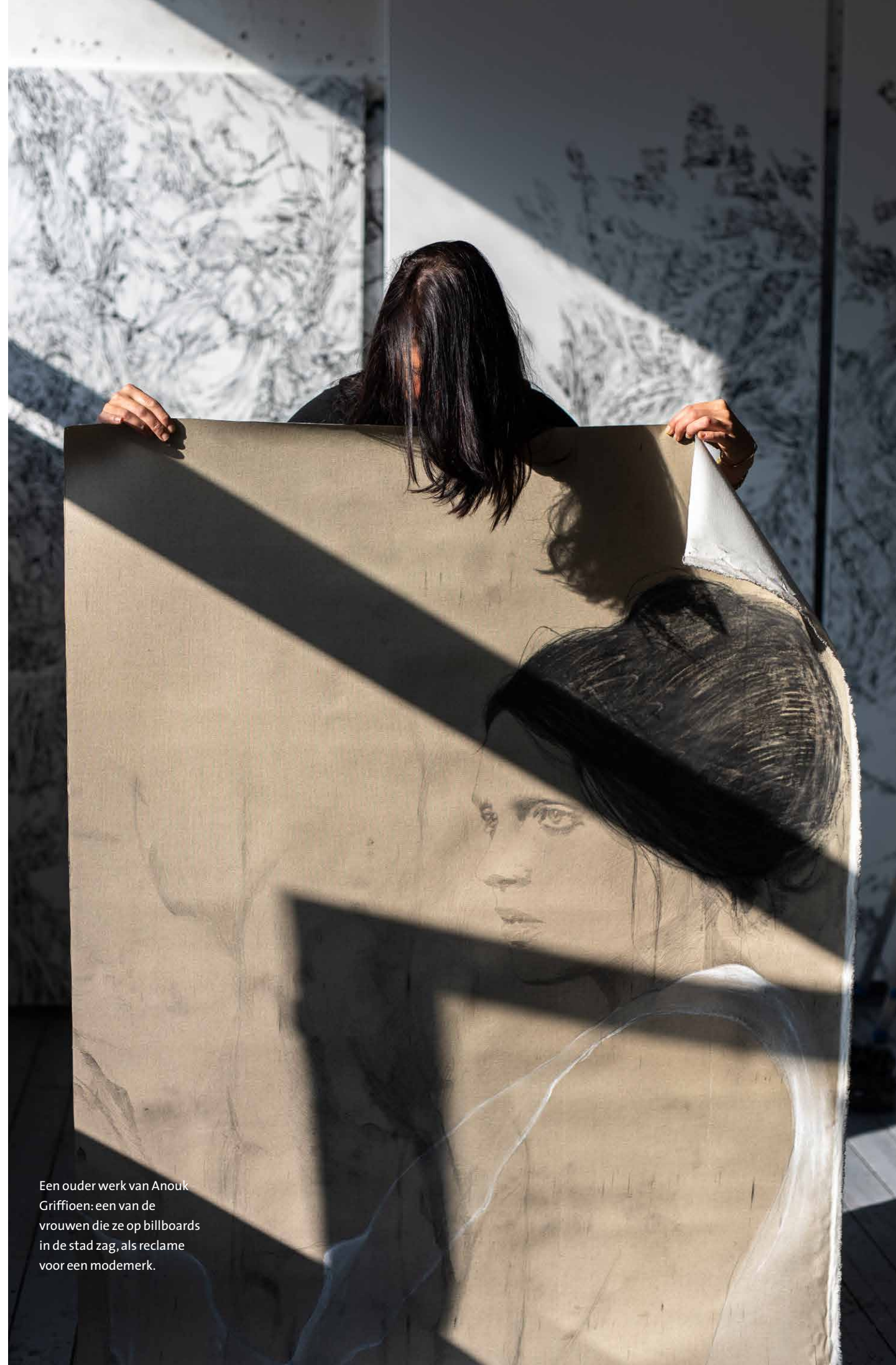
Een ouder werk van Anouk Griffioen: een van de vrouwen die ze op billboards in de stad zag, als reclame voor een modemerik.