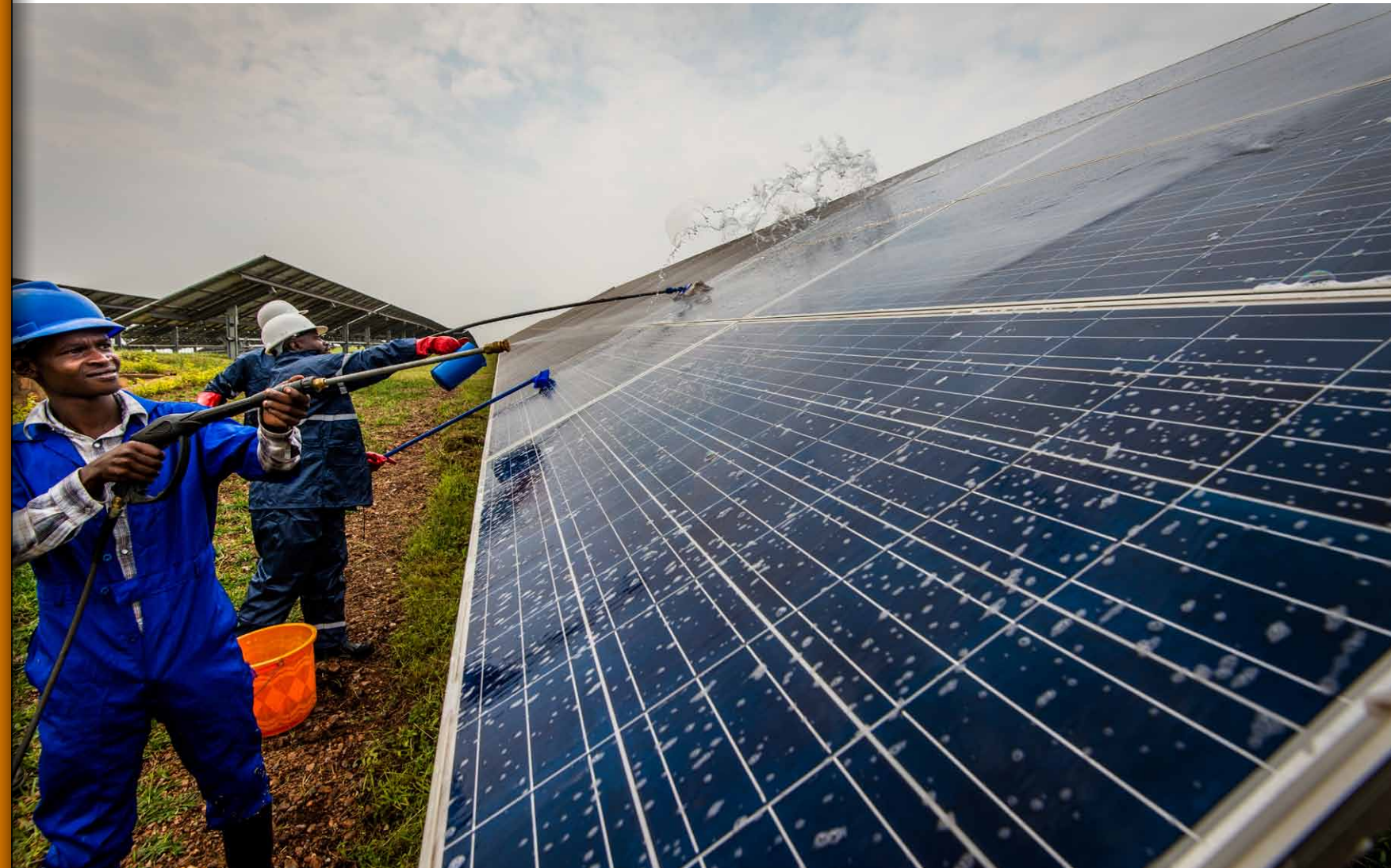
De bouw van zonne-energieparken kost steeds minder tijd: het 8,5 MW Gigawatt Solar project in Rwanda (het eerste in Oost-Afrika) verrees in minder dan een jaar.

Door de lagere prijzen voor duurzame energie komen er meer partijen op de markt. Dat is alleen maar goed, en houdt ons scherp. Ik hoop dat het ertoe leidt dat op termijn bijdragen van overheden of internationale financiële instellingen niet meer nodig zijn om beleggers zoals pensioenfondsen over de streep te trekken. Maar dan nog: dat soort institutionele beleggers willen niet altijd zelf actief op zoek gaan naar projecten, daar zijn ze niet voor opgezet. En dus blijven fondsen zoals het onze nodig om hen te bedienen met kwalitatief hoogstaande duurzame projecten, die ook een mooi rendement opleveren.”