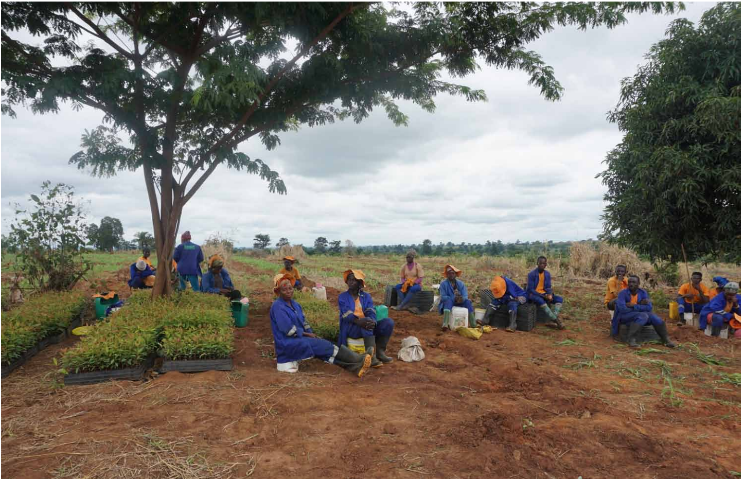
Bosbouw, vaak gecombineerd met landbouw ( agroforestry ), biedt veel kansen voor Afrikaanse boeren