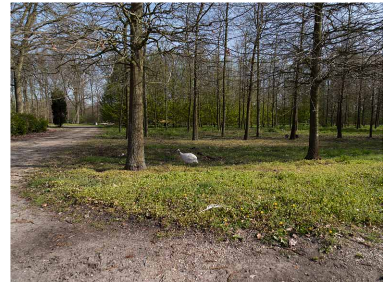
Boomkwekerijen kunnen te grote bomen rooien, maar ook uitdunnen, om de overgebleven kruinen meer ruimte te geven om nog even evenwichtig door te groeien, in afwachting van betere tijden.