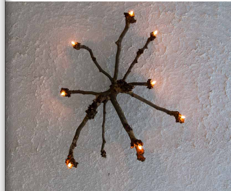
Ook dakplatanen kunnen te fors worden, maar afgezaagd bij de kop vormen ze een natuurlijke kroonluchter.