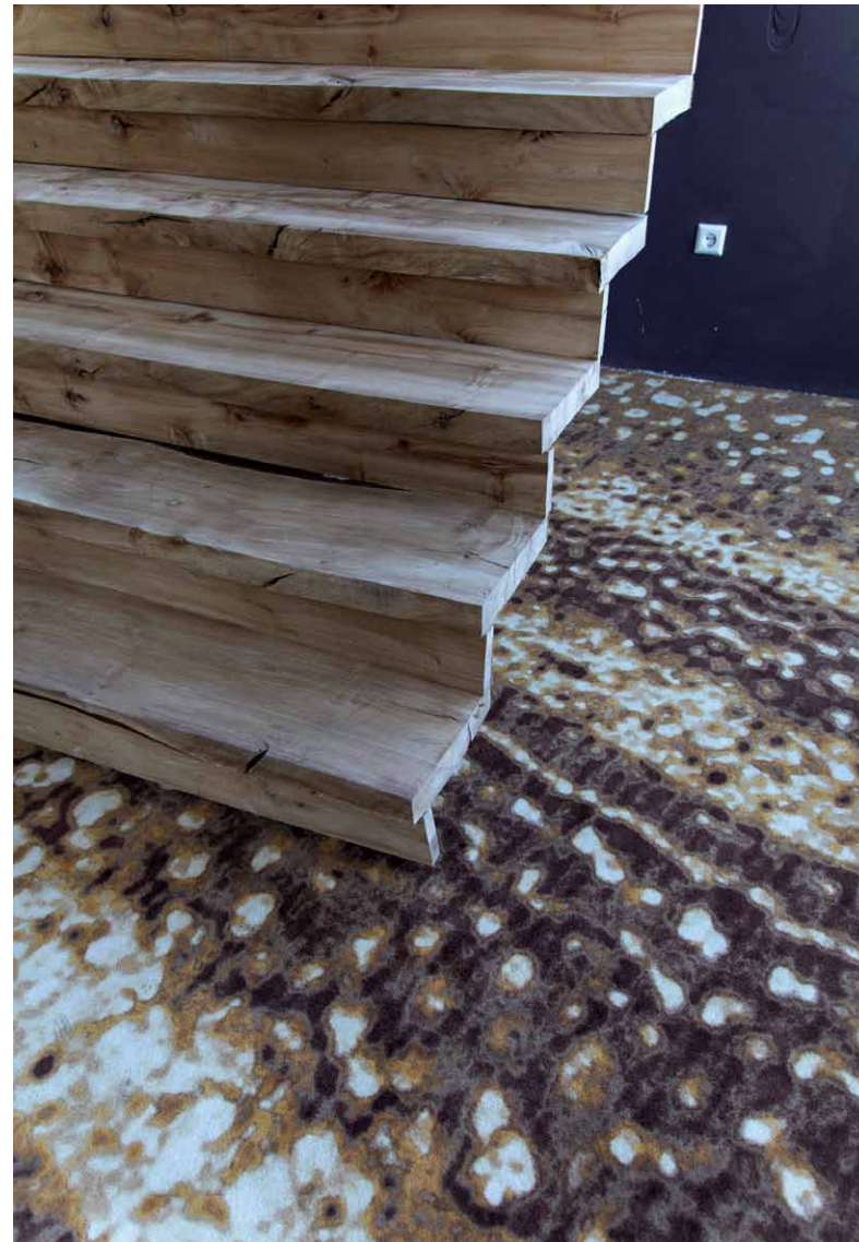
Te groot gegroeide notenbomen liet Blokzijl omzagen en verwerken tot een unieke trap.

➤ eigenlijk al net zo goed uit halen, want je weet: zo'n grote boom met een bijpassende vraagprijs, die verkoop je toch niet meer. Bomen zijn de sluitpost van de gemeentebegroting. Er worden geen woonwijken van duizend huizen meer gebouwd, nergens. Het zijn plukjes van honderden huizen. Eerst komen de straatstenen, dan de lantaarnpalen. En dan denkt de aanbestedende ambtenaar: 'Oh ja, er moeten ook nog een paar bomen ook bij'. Voor dat resterende bedrag kunnen serieuze, professionele kwekers alleen maar kleine boompjes leveren." De kweker heeft het dan over bomen tot 4 of 5 meter. Kwekers die aan het buitenland hebben een langere uitloop: zijn mogen leveren formaten van 9 tot 11 meter leveren.