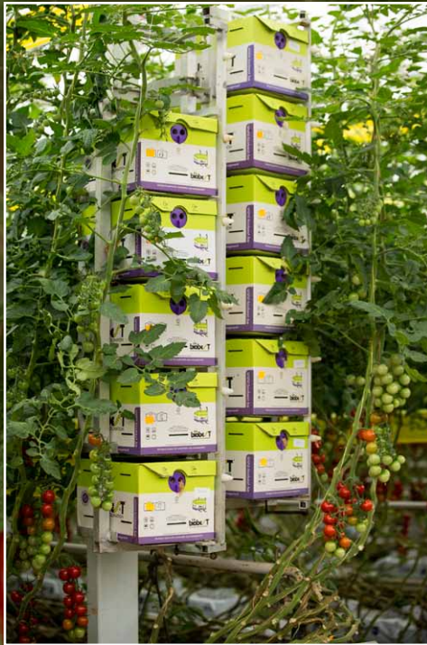
Bij kweker Royal Pride zorgen dikke hommels voor de bestuiving van de tomaten.