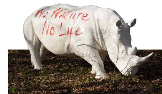
Een grazende neushoorn maakt in de groenstrook een statement over natuurbescherming en onszelf.

E n toch heet deze pleisterplaats ‘De Groene Afslag’. En is er op het beeldmerk ruimte gemaakt om de plek aan te duiden: Afslag 8 van de A1, ter hoogte van Blaricum. En dan even zoeken in zuidelijke richting naar Bussum, waar een asielzoekerscentrum zat, maar nog veel eerder de Landmacht gelegerd was. “Wij zitten in slaapbarakken waar het kanonnenvoer ondergebracht was, de soldaten”, wijst Mol naar het oude gebouw, waar nu twee witte kunststoffen neushoorns op wacht staan. “We krijgen hooguit drie jaar om ons te bewijzen, daarna gaat dit gebouw tegen de vlakke. Dit is een Pop-Up.”