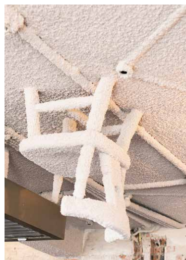
In het plafond verwerkt: van de sloop geredde stoeltjes.