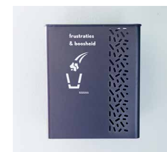
Bij de afvalscheiding hoort ook een prullenbak om je frustraties in weg te gooien.

Behalve een plek voor horeca, werken en vergaderen, moet De Groene Afslag ook een inspiratieplek zijn ‘waar je met een groen humeur naar buiten rolt’.