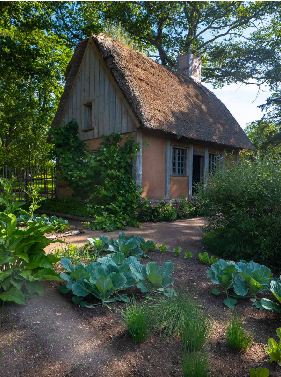
De historische tuin in Annapolis Royal, met de moestuin van de eerste pioniers uit Europa, de Acadians.