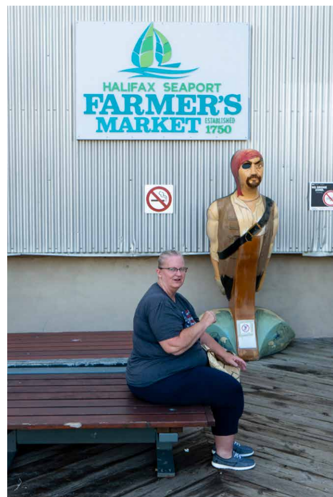
De Halifax Farmers Market, op elke zaterdag sinds 1750.

De oudste en nog steeds opererende boerenmarkt in Noord-Amerika dateert al van juni 1750 en gaat daarmee in de richting van de 300 jaar. Deze Halifax Farmers Market werd bij 'Royal Decree' opgericht door de Britse gouverneur Edward Cornwallis, een jaar nadat hij de stad Halifax tot nieuwe hoofdstad had uitgeroepen. De Canadese provincie Nova Scotia was in die tijd nog een handelspost waar vooral soldaten, kooplieden en vissers woonden – naast First Nations van de stam Mi'kmaq. Boeren moesten de eerste bewoners van groenten, vlees, melk, eieren en kippen voorzien, bij voorkeur levend. De dieren werden ter plekke geslacht. De boeren maakten lange nachtelijke tochten om de beste marktplekken te kunnen bezetten, waar ze hun waren vanaf de boerenkar verkochten. Sommige boerinnen kwamen zelfs te voet, tochten van 65 kilometers makend over modderige of bevroren weggetjes. Naast voeding brachten de boeren ook hout naar de stad, om de eerste huizen te verwarmen, en hooi voor de paarden van het Britse garnizoen.