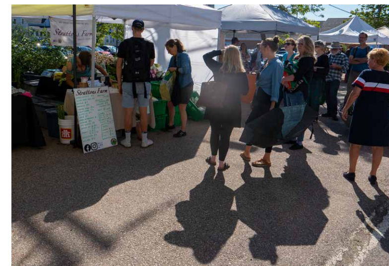
Lange rijen wachtende Canadezen voor de biologische groenten die Strattons Farm op de boerenmarkt van Annapolis Royal aanbiedt.

Voor het kraampje van de biologische Strattons Farm in Annapolis Royal staat op zaterdag een lange rij van beleeft op hun beurt wachtende Canadezen. De verkoopster komt handen te kort om haar superverse onbespoten groenten in te pakken. Strattons Farm is een voorbeeld van het type boerenbedrijf dat door hippies werd begonnen uit kritiek op de 'consumptie-maatschappij' en het 'plastic voedsel vol gif' in de supermarkten. Onder andere Vermont staat te boek als de Amerikaanse staat waar tal van deze 'drop outs' oude boerderijen en schuren opkochten om daar een zelfvoorzienend bestaan op te bouwen. Hier ontstonden ook de eerste 'donkergroene' voedselcoöperaties, die markten in de stad begonnen te organiseren om daar hun overschot aan boerderijproducten te verkopen. De 'Northeast Organic Farming Association' bijvoorbeeld dateert van