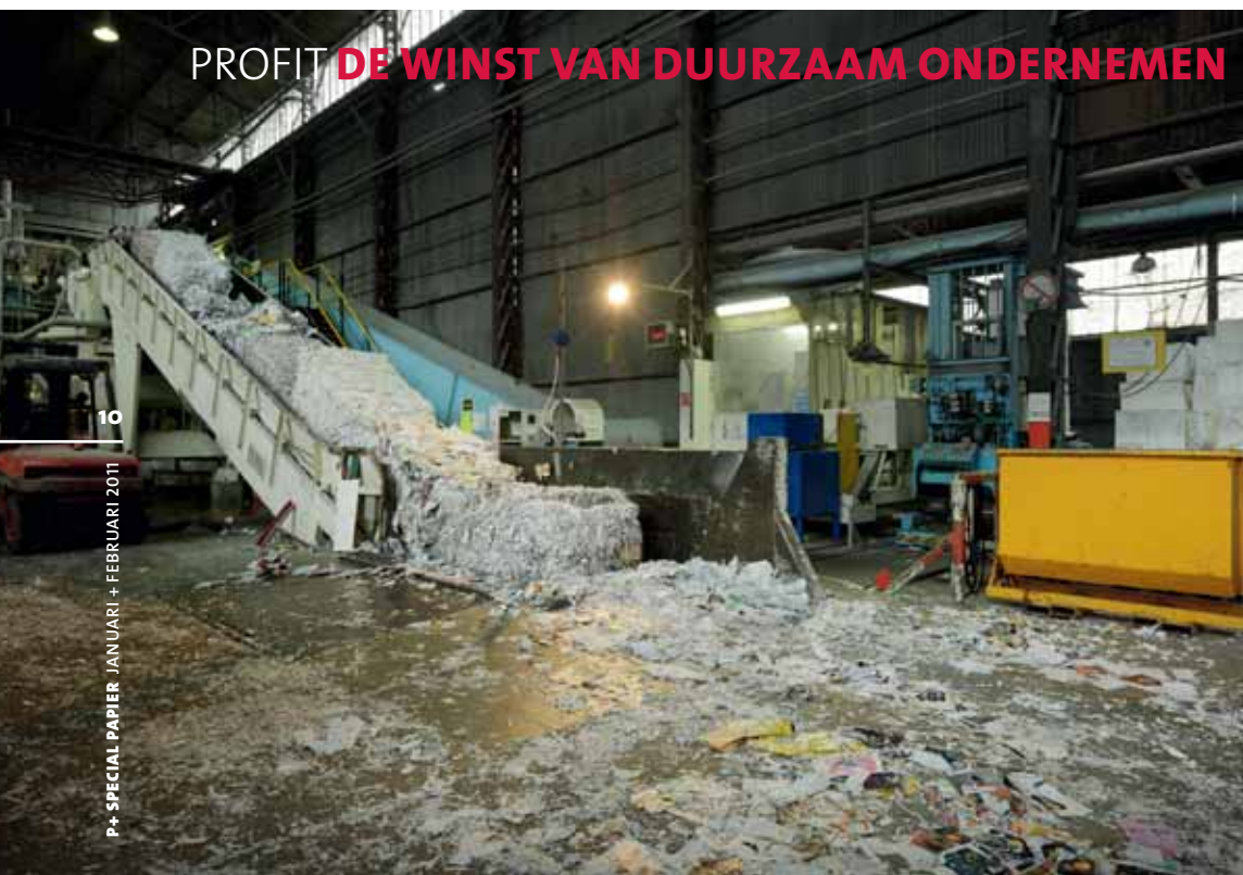
P+ SPECIAL PAPIER JANUARI + FEBRUARI 2011 10