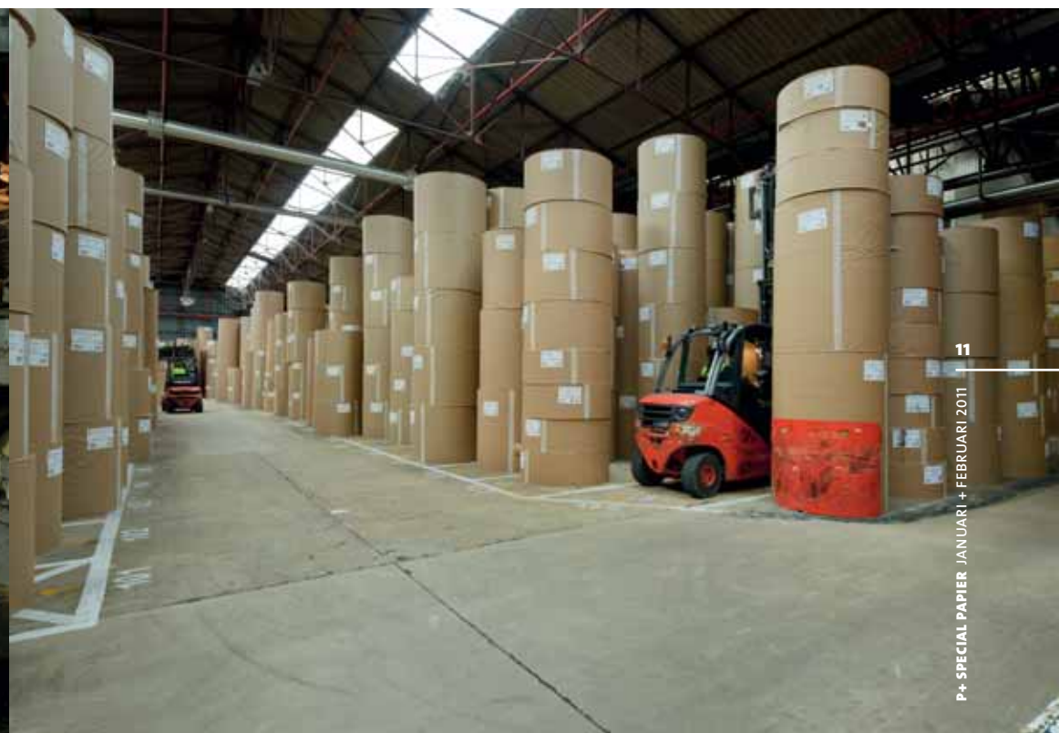
P+ SPECIAL PAPIER JANUARI + FEBRUARI 2011 11