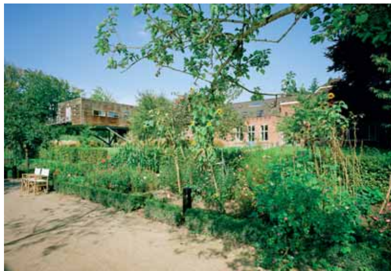
De omringende tuinen van ZIN bieden tegelijkertijd ruimte aan contemplatie en praktisch nut.

Een rustoord voor hoogbejaarde fraters laat zich niet zomaar tot een conferentieoord ombouwen. Honderden vragen buiten over elkaar heen. Wat doen we met de begraafplaats, die op het eerste oog een militair kerkhof lijkt, maar de laatste rustplaats is voor alle lekenbroeders? Op de kruizen prijken namen als Germanus van Rijsewijk, Viventius de Gier of Caesarius Mommers, de 'leesvader van Nederland' die een katholiek leesplankje ontwikkelde op basis waarvan vijf miljoen Nederlanders en Vlamingen leerden lezen. Niet in de volgorde aap-nootmies, maar: aap-roos-zeef. Moet je een hoge haag om al deze in het gelid staande gedenksteden heen plaatsen? Is het wel verstandig om bezoekers te confronteren met de doden? Ja, luidde het eindoordeel: we plaatsen zelfs geen lage heg. Laat deze rustplaats maar rustig zien. "Voor ons gaan de doden straks leven", zeggen de fraters.