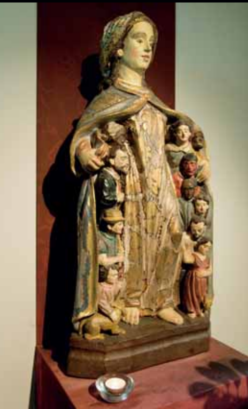
Een Braziliaanse Maria als barmhartige beschermvrouwe.