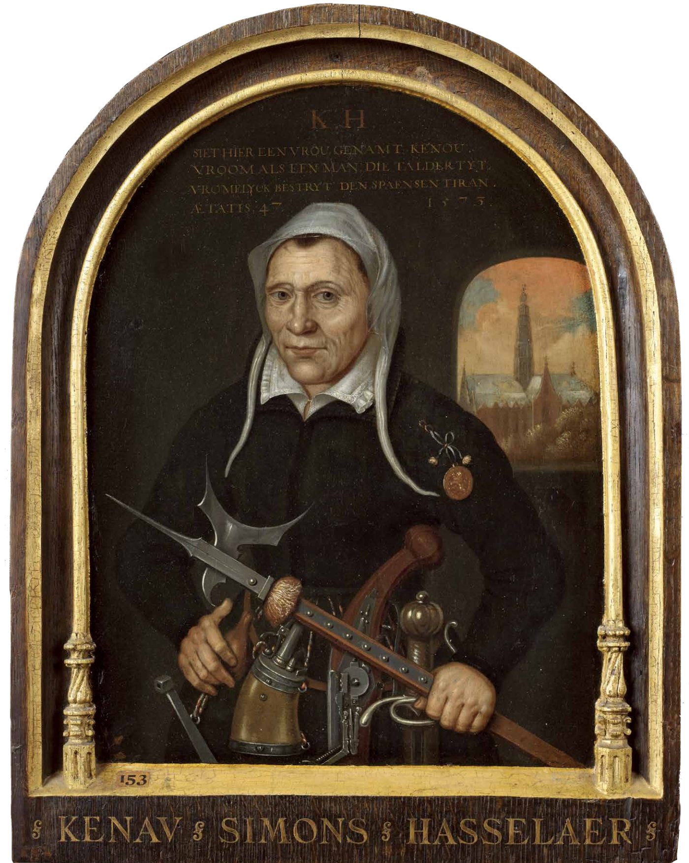
Handelsvrouw Kenau Simonsdochter Hasselaer. In de Gouden Eeuw nog gezien als een heldin, die in 1573 meevocht en hout leverde toen de Spanjaarden de stad Haarlem belegerden. Vandaag staat haar voornaam synoniem voor 'manwif', niet bepaald een positieve typering. Een schilderij uit het Rijksmuseum (ca. 1590-1609).

Bijzonder aan jouw boek is de beschrijving van de gelijkwaardige positie van de vrouw in de Gouden Eeuw. Eigenlijk is het heel logisch: wanneer de man in het buitenland op zakenreis is, moet er iemand op de winkel passen. Het geluk was dat vrouwen in die tijd boekhoudkundig onderlegd waren en echtgenotes dus de honneurs waarnamen. ►