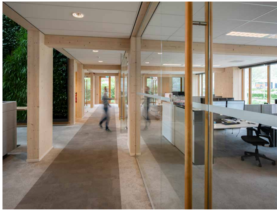
Interface vloertegels in de kantoorruimten.

➤ doen, steeds voor de hoogste duurzaamheidsopties. Het resultaat: het houten gebouw kreeg bij de opening in 2016 de eretitel van het meest duurzame kantoor ter wereld. En dat is het tot op de dag van vandaag gebleven. Geelen scoorde een unieke 99,94 procent in het certificeringssysteem van BREEAM. Over het niet halen van die laatste 0,06 procent heeft hij nog steeds een beetje de pest in. “Dat ligt aan de ligging van ons pand, in een landelijk gebied, ver van spoorlijnen en ander openbaar vervoer. Het Britse